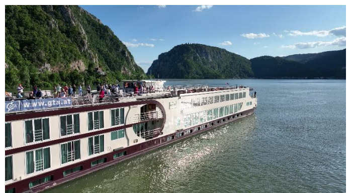
MS Nestroy im Eisernen Tor