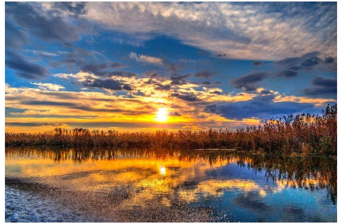
Donaudelta bei Sonnenuntergang