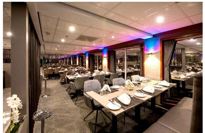
MS Nestroy, Restaurant