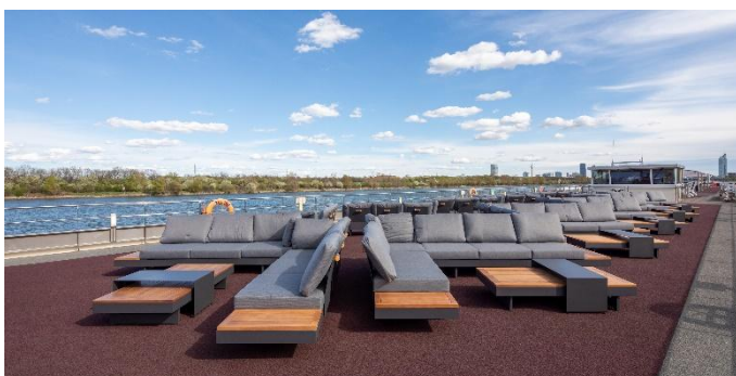
MS Nestroy, Lounge Sonnendeck