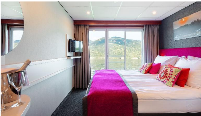
MS Nestroy, Doppelkabine Schiller- / Goethedeck

Änderungen des Reiseverlaufs und Ausflugsprogramm bleiben seitens der Reederei vorbehalten. Bitte beachten Sie, dass es aufgrund von Niedrig-/Hochwasser zu unvorhergesehenen Wartezeiten bei den Schleusen oder auch aufgrund von Witterungsbedingungen zu Verspätungen und daher zu Änderungen des Ausflugsprogramms oder ev. auch der Ein-/Ausstiegstellen kommen kann. Ebenso behält sich die Reederei das Recht vor, die Gäste, insbesondere infolge von Niedrig-/Hochwasser oder Schiffsdefekt, alternativ zu befördern bzw. unterzubringen (z.B. mit Bussen bzw. in Hotels) und allenfalls den Streckenverlauf zu ändern; unter Umständen ist auch der Umstieg auf ein anderes Schiff erforderlich.