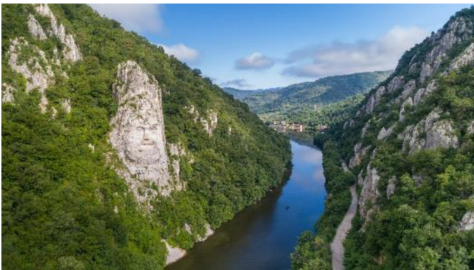
Eisernes Tor mit Decebal