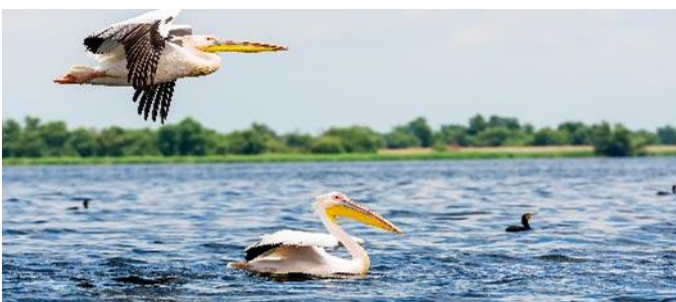
Pelikane im Donaudelta