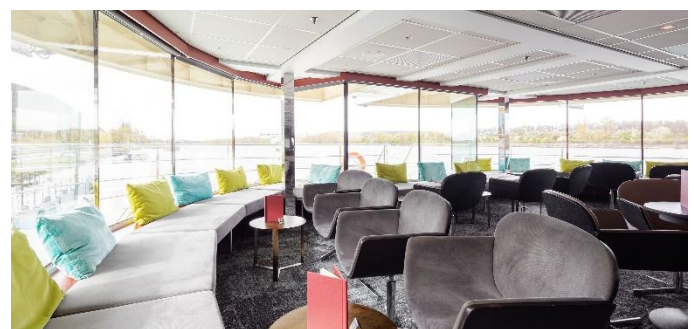
MS Nestroy, Panoramabar